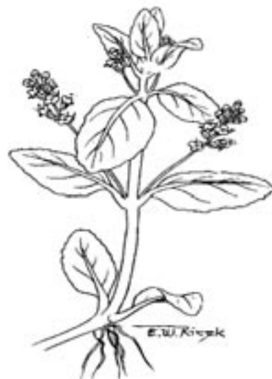
Przetacznik bobrowniczek łac. Veronica beccabunga

Niekiedy przybierają w nadmiarze «złe soki» w człowieku, są wodniste i cienkie. Stają na drodze krwi w naczyniach krwionośnych w taki sposób, że krew nie wydalona z pożywieniem, z człowieka wy-