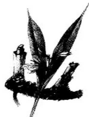
Najlepsza z przypraw – alpinia lekarska (łac. Alpinia galanga lub officinarum )

W taki sposób dotyka Hildegarda „klawiszy natury”, można by było ją porównać do muzyka. Zna ona najsłabszy nawet ton, tępy, słaby, gorzki, delikatny czy też miękki. Dla każdej rośliny i każdej potrawy zna odpowiedni ton. To jest muzyka, o której my cywilizowani ludzie dwudziestego wieku zapomnieliśmy. Struny naszych instrumentów smakowych są całkiem rozstrojone. Kucharze oraz kucharki powinni powoli zacząć zdrać sobie sprawę z odpowiedzialności, jaka leży w ich rękach. Osoby stojące przy piecu kuchennym mogą